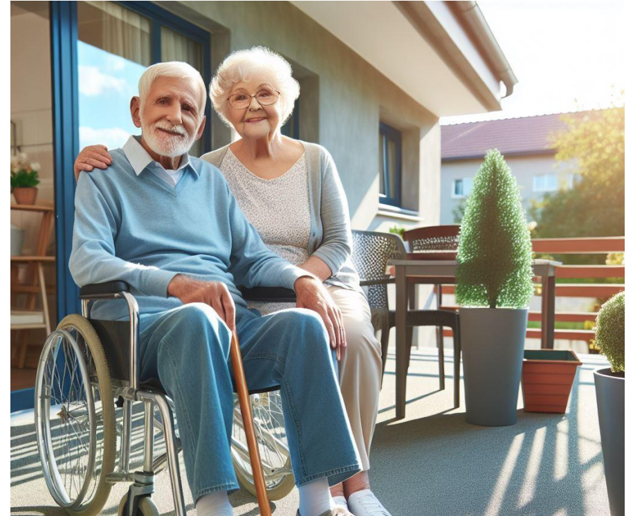
Bildet er KI-generert